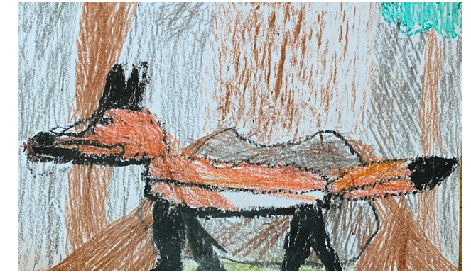
"ZORRO ROJO CERCA DE LA GUARIDA" Por John

¿Sabía usted que tenemos dos especies de zorros en Rhode Island? Estos son el zorro rojo y el zorro gris. Ambos son depredadores importantes de ratones y otros roedores. ¡Los zorros a veces pueden causar problemas para la gente, especialmente si tienen gallinas!