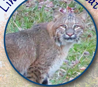
Lince Rojo "Bobcat"

¿Puedes emparejar/ igualar cada mamífero de Rhode Island con sus huellas?