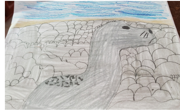
FOCA DE PUERTO "HARBOR SEAL" DE NUEVA INGLATERRA

"El nombre científico para las Focas de Puerto significa "perros marinos." Tienen pelaje gris o café con manchas y pesan entre 150-300 libras. Las Focas de Puerto machos pesan más que las hembras. No tienen orejas solamente orificios auditivos.