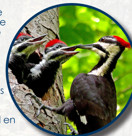
Una Madre Picamadero norteamericano o Pito Crestado "pileated" alimentando a sus polluelos

trabajar. Con el tiempo, nuestros bosques volvieron a crecer, y también nuestra vida salvaje comenzó a retornar. Animales como la Marta Pescadora o "Fisher" y el Picamadero norteamericano o Pito Crestado "pileated woodpecker" son ahora frecuentemente vistos en Rhode Island. A estas criaturas les gusta el hábitat de los bosques maduros . Esto es un bosque que tiene entre 70 y 100 años. La mayor parte de nuestro hábitat forestal en todo el estado tiene alrededor de esta edad.