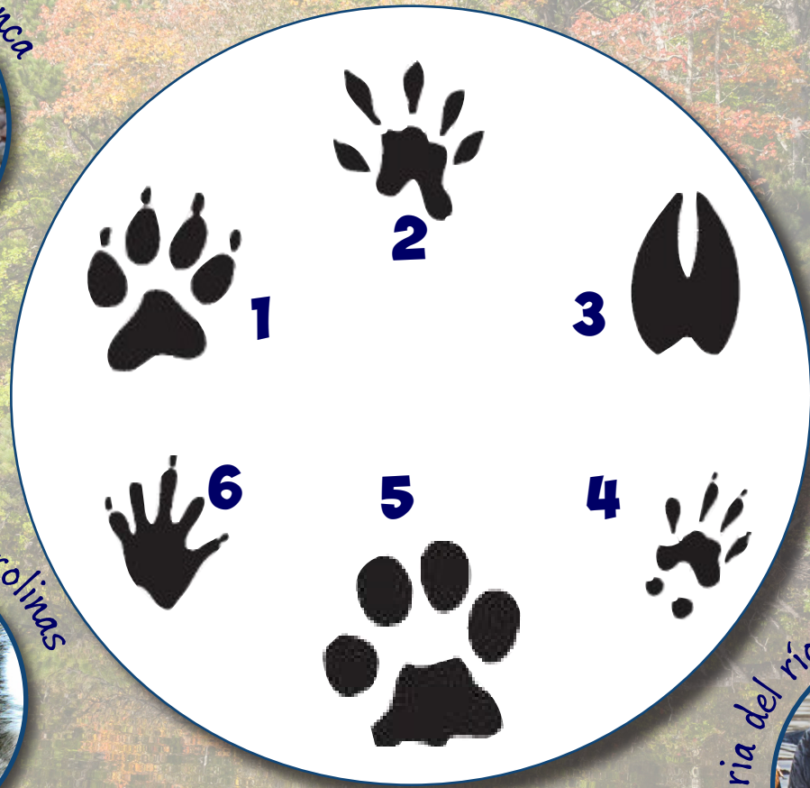
Nutria del río de América del Norte