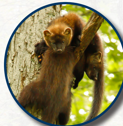
"Bebes de una Marta Pescadora o "Fisher" (llamados "kits") juntos jugando en un árbol

El apodo de Rhode Island es "The Ocean State" por sus bellas costas y la Bahía de Narragansett, ¡pero también tenemos algunos bosques increíbles! Más de la mitad del terreno en Rhode Island está cubierto por el hábitat forestal! ¡Esos son muchos árboles! Pero, no siempre había muchos bosques en Rhode Island. Muchos de ellos fueron cortados para granjas o para madera , causando que algunos animales silvestres que necesitan bosques desaparecieran de nuestro estado.